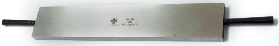
Рисунок 1 - Общий вид брусков контрольных

На боковые поверхности бруска контрольного нанесены риски, отмечающие точки наименьшего прогиба, на которые брусок контрольный устанавливается на поверочной плите перед началом работы.