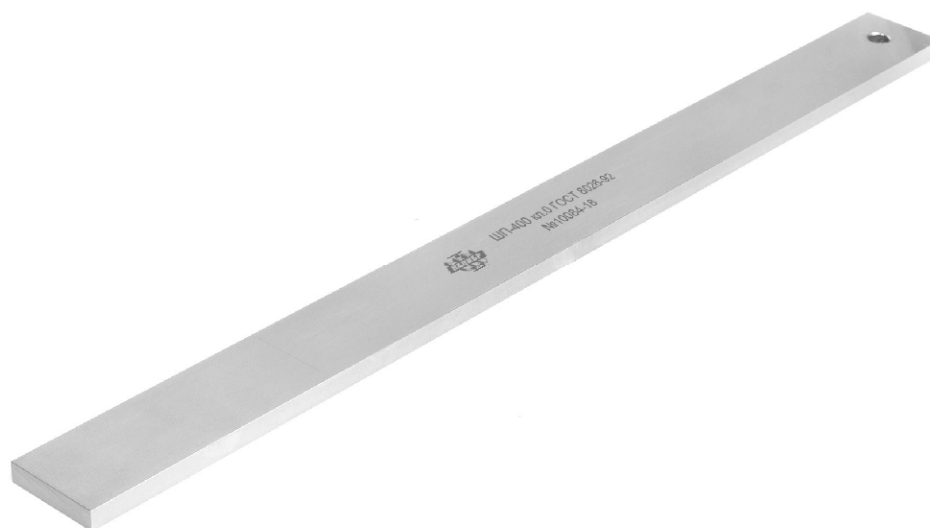
Рисунок 4 – Общий вид линейек типа ШП